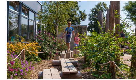
1) DWERGENPAD ROBINIA