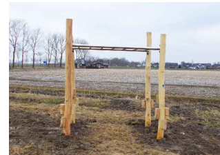
2) ENTERREK ROBINIA NIEUW