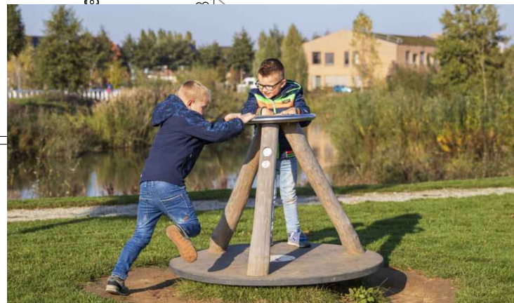
1) DRAAITOESTEL NIEUW