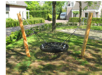
1) KLEINE VOGELNESTSCHOMMEL