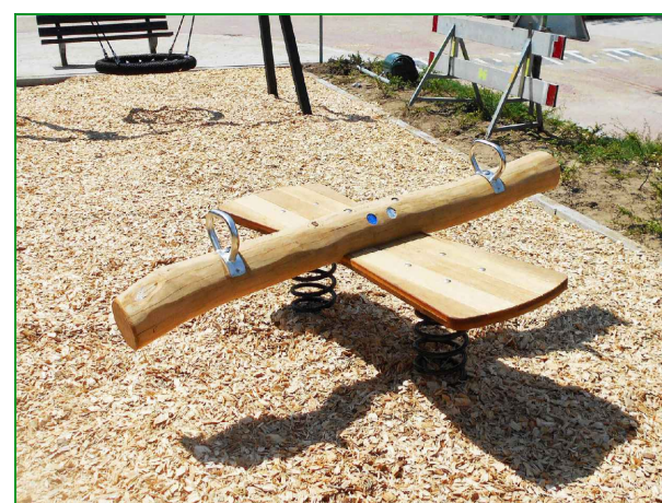
1) VLINDERWIP PST.000.141 OF GELIJKWAARDIG