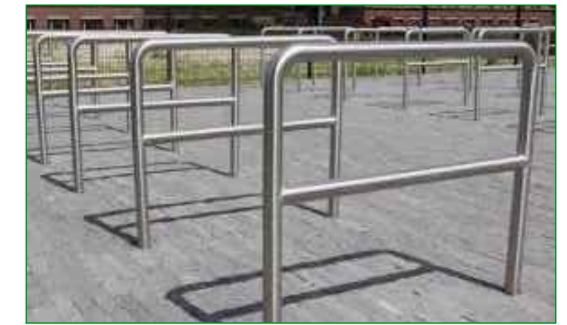
12) SLUISJE IVM SCOOTERS WEREN FIETSAANLEUNBEUGEL MET TUSSENBUIJ