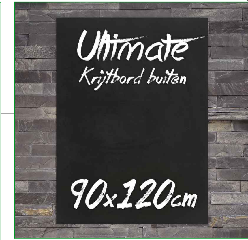
8) BUITENSCHOOLBORDEN, 2 STUKS