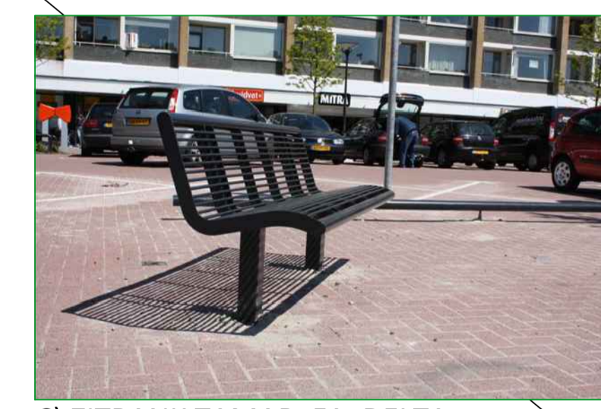
6) ZITBANK TAMAR, FA. DELTA